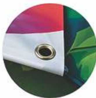
OJALES Facilitan la instalación de tu banner.