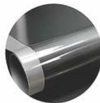
LAMINADO Protege de la intemperie y prolonga la vida útil.