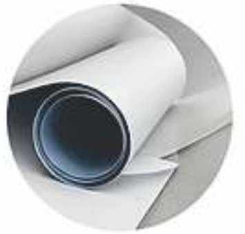
REFILADO Bordes limpios para una mejor presentación.