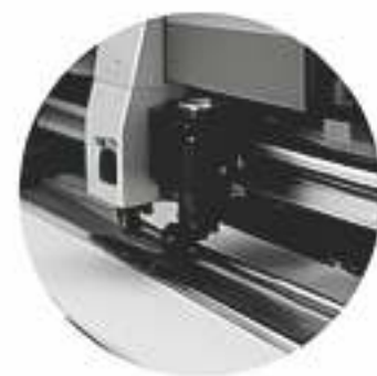
CORTE Acabados profesionales y a la medida.